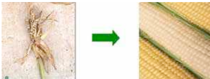
TEOSINTE / MAÍZ

Un ejemplo de este proceso lo constituye el maíz. Hace miles de años, indígenas que habitaban en lo que hoy es México comenzaron el lento proceso de domesticación del teosinte, el antecesor del maíz moderno.