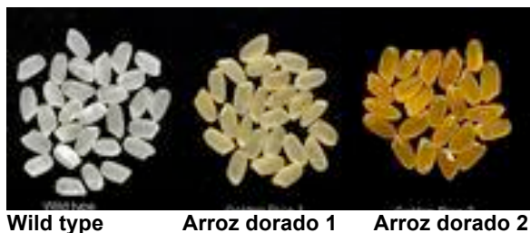
Wild type Arroz dorado 1 Arroz dorado 2

genes homólogos (que codifican para la misma enzima) obtenidos de parientes más cercanos evolutivamente al arroz, esperando que funcionen mejor en ese nuevo entorno. Así, reemplazando el gen de narciso para la enzima PSY por otras versiones de distintas plantas, los investigadores hallaron que los genes obtenidos de maíz y arroz daban mejores resultados, llegando a obtener hasta 20 veces más de pro-vitamina A respecto de las primeras plantas desarrolladas (figura 5).