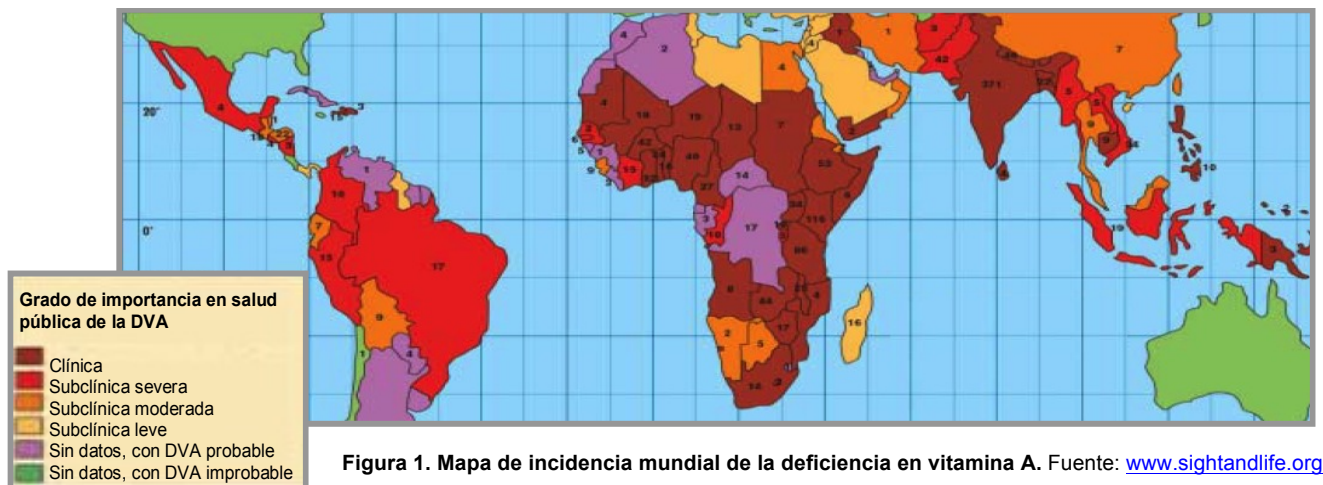
Figura 1. Mapa de incidencia mundial de la deficiencia en vitamina A.

La deficiencia de vitamina A (DVA) es una de las principales causas de ceguera y muerte prematura en los niños que viven en sociedades que basan su alimentación en el arroz, como muchos países asiáticos y africanos (ver figura 1)