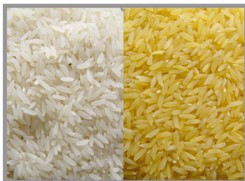
Figura 4. Granos de arroz dorado. Los granos de arroz dorados son fácilmente reconocibles por su color amarillento, un color más intenso significa mayor contenido de beta-carotenos.

En el arroz dorado se han introducido por ingeniería genética dos genes al material genético del arroz. Estos genes codifican para las enzimas fitoeno sintetasa y fitoeno desaturasa , necesarias para completar la ruta metabólica que permite la síntesis y acumulación de beta-carotenos en los granos de arroz (ver Figura 2). De hecho, la intensidad del color dorado en el nuevo arroz es un indicador de la concentración de beta-carotenos en el endosperma (figura 4).