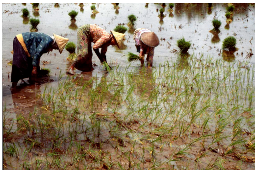
Figura 6. Cultivo de arroz. Las fotos muestran cómo los agricultores de países asiáticos cultivan arroz.

Para lograr el objetivo de disminuir la deficiencia de pro-vitamina A en los países pobres que se alimentan a base de arroz, el arroz dorado debía llegar a manos de los granjeros de esos países sin cargos ni restricciones. Debían conseguir el permiso de aquellos organismos que habían financiado el proyecto, lo que podía ser acordado, pero el problema residía en todos los derechos de patentes de los procedimientos implicados para el desarrollo del Arroz Dorado. Por ejemplo, los procedimientos de transformación vegetal. Afortunadamente, dada la relevancia del desarrollo, varias empresas otorgaron libertad de licencias para que se pudiera utilizar el Arroz Dorado de manera “humanitaria”, y así llegar con él a los lugares que realmente lo necesitan. El proyecto del arroz dorado intenta que agricultores de países subdesarrollados puedan obtener las semillas sin costo, y cultivar la nueva variedad de arroz sin cambiar sus costumbres y metodologías agrícolas (figura 6).