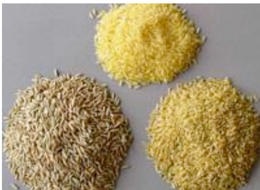
Figura 3. El arroz como alimento. El arroz es la mayor fuente alimentaria de más de media población mundial, y carece de gran parte de los nutrientes esenciales. La gente que no puede sustentar una dieta variada sufre diferentes deficiencias. Además, algunos nutrientes importantes del arroz se pierden durante el pulido, pero el grano no procesado no puede ser almacenado, debido a la presencia en la capa externa de lípidos susceptibles a la oxidación, que vuelven al grano rancio y no apto

El arroz es el alimento principal de más de 3 billones de personas, siendo la mayor fuente de hidratos de carbono y también de proteínas en países del sudeste asiático y África. Pero, el arroz es una fuente pobre en varios micronutrientes esenciales. Por eso, una dieta basada en arroz es la causa primaria de carencia de micronutrientes en gran parte de los países subdesarrollados, particularmente hierro, zinc y vitamina A. Las consecuencias de esta malnutrición incluyen, entre otras, disminución de la capacidad mental, ceguera, mayor mortalidad infantil, baja productividad laboral e inestabilidad.