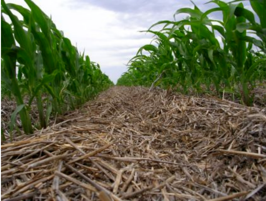
Maíz sembrado bajo el sistema de Siembra Directa.