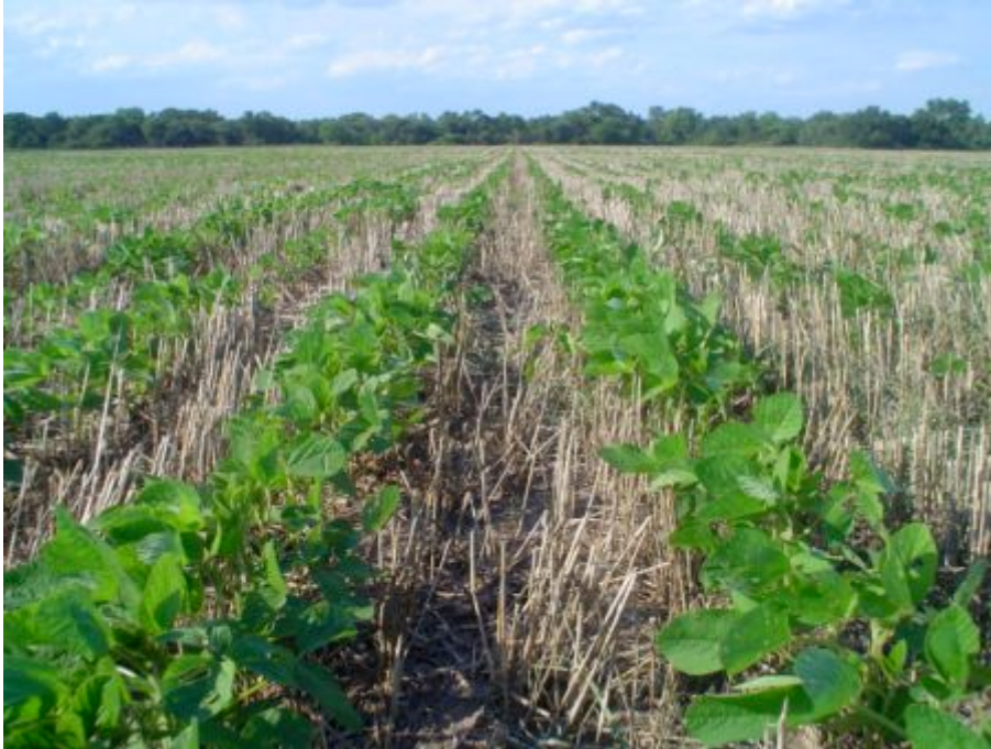
Soja sembrada bajo el sistema de Siembra Directa.